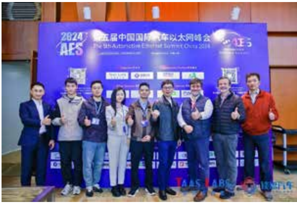
Image 1: KDPOF and Hinge Technology jointly presented at Automotive Ethernet Summit in Shanghai

马德里（西班牙）——KDPOF（严苛环境下高速光纤连接领先供应商）自豪地宣布与赫千科技（中国领先的先进车用电子架构供应商）达成战略合作伙伴关系，以解决车辆光通信工业应用中的关键技术问题。