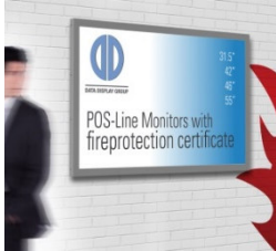
Imagen 1: Smoke and fire load optimized Monitors for areas with strict fire regulations