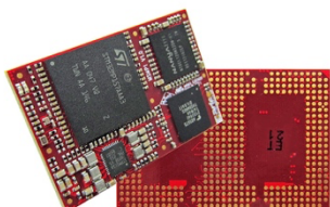
Imagen 2: El versátil MSMP1 SiP de Aries Embedded se basa en la MPU STM32MP1 de ST Microelectronics

Descarga: https://www.ahlendorf-news.com/media/news/images/aries-embedded-msmp1-sip-stmicroelectronics-1-H.jpg