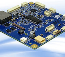
Bild 1: SmartLED von Distec ist ein universeller, konfigurierbarer LED-Konverter für unterschiedliche TFT-Displays