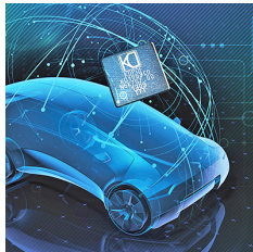
Bild 1: Zukunftsweisend: Automotive Gigabit-Ethernet von KDPOF bietet elektromagnetische Verträglichkeit, Robustheit und mühelose Integration