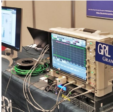
Bild 1: Granite River Labs und KDPOF kooperieren für ISO-standardisiertes Automotive Ethernet über optische Polymerfaser

Bildquelle/Copyright: KDPOF Download: https://www.ahrendorf-news.com/media/news/images/KDPOF-Granite-River-Labs-ISO-21111-optical-gigabit-ethernet-H.jpg