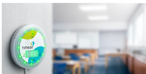
Der timeair im Veranstaltungsraum

Bildquelle: Wiesemann & Theis Download: https://www.ahlendorf-news.com/media/news/images/wiesemann-theis-timeair-veranstaltungsraum-H.jpg