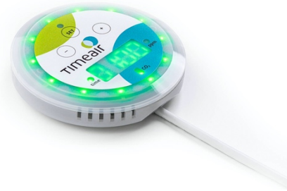
Der timeair von W&T im Normalbetrieb

Bildquelle: Wiesemann & Theis Download: https://www.ahlendorf-news.com/media/news/images/wiesemann-theis-timeair-co2alarm-H.jpg