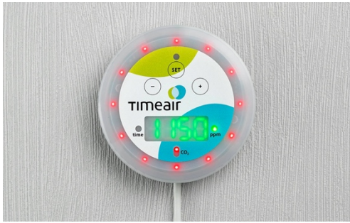
Der Grenzwert ist überschritten, der Alarm wird ausgelöst

Bildquelle: Wiesemann & Theis Download: https://www.ahlendorf-news.com/media/news/images/wiesemann-theis-timeair-co2alarm-H.jpg