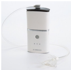
Bild 1: Innovatives „iNAP One“ von Somnics für ruhigen und erholsamen Schlaf ohne Schlafapnoe